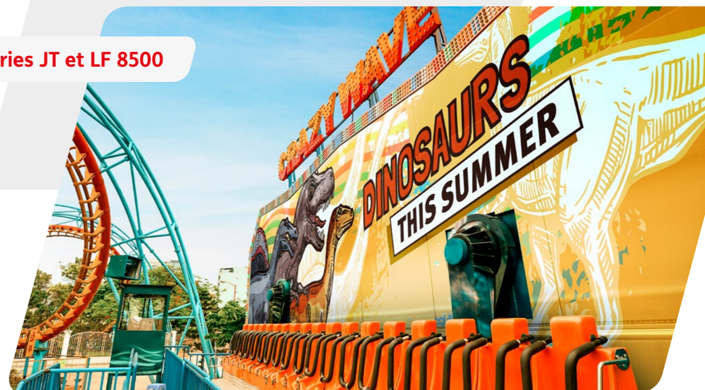
Séries JT et LF 8500

AVERTISSEMENT - Toutes les déclarations, les informations techniques et les recommandations d'Avery Dennison sont fondées sur des tests estimés fiables, mais ne constituent aucunement une garantie. Tous les produits Avery Dennison sont vendus selon les conditions générales de vente d'Avery Dennison, se reporter à la page http://terms.europe.averydennison.com . Il incombe à l'acheteur de déterminer de façon indépendante l'adéquation du produit pour l'utilisation prévue.