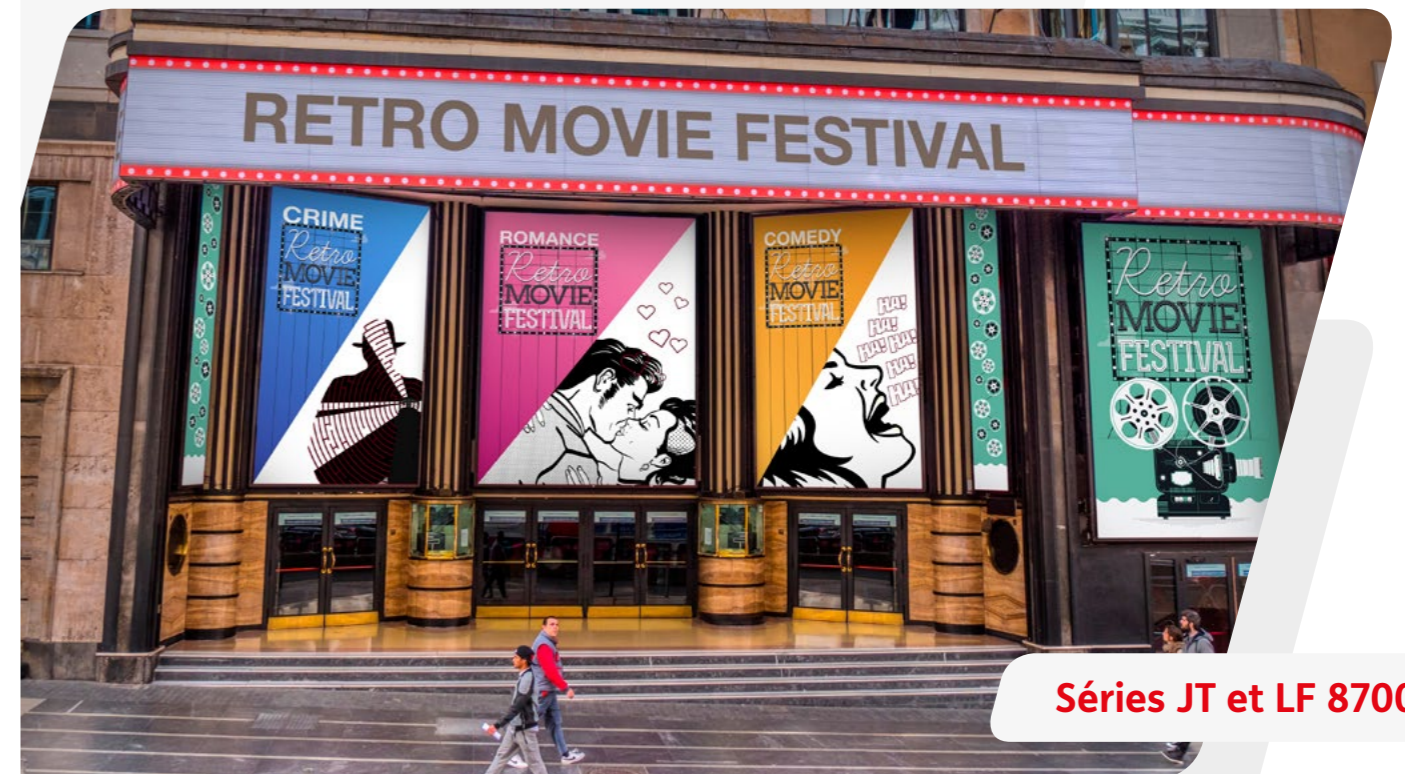
Séries JT et LF 8700

Pour les surfaces planes qui ne manquent pas de relief !